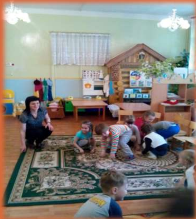
Подвижная игра с детьми «Вернись в свое гнездышко!»