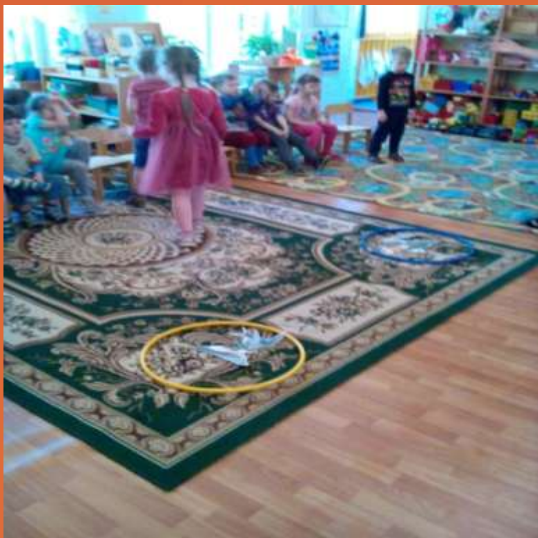
Подвижная, развивающая игра «Зимующие и перелетные птицы»